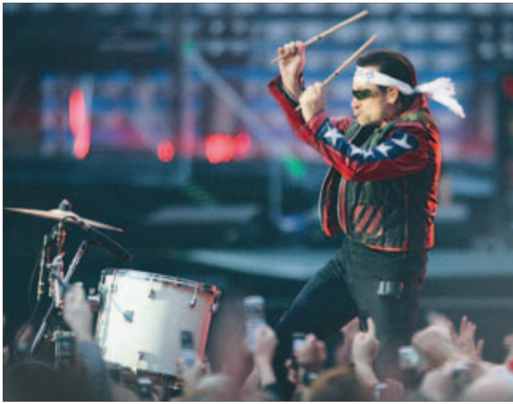
Bono aan de slag in Manchester. U2 is over een maand in Nederland op de Vertigo 2005 tournee.